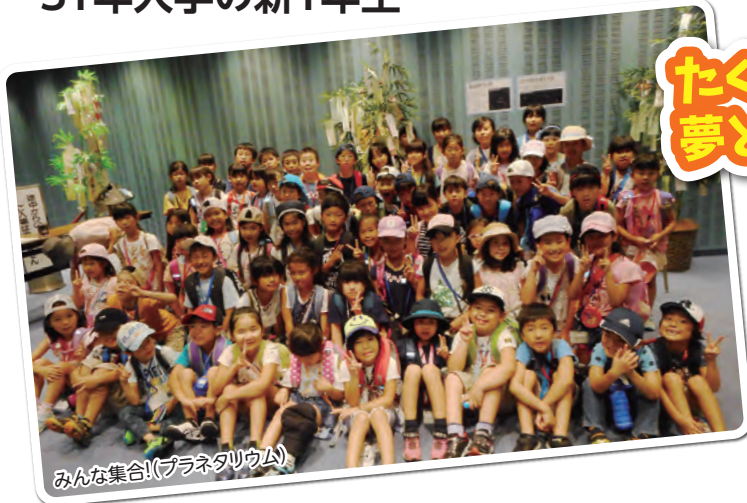
みんな集合!(プラネタリウム)