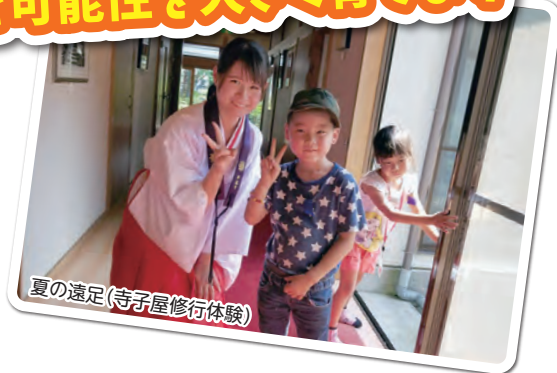
夏の遠足(寺子屋修行体験)